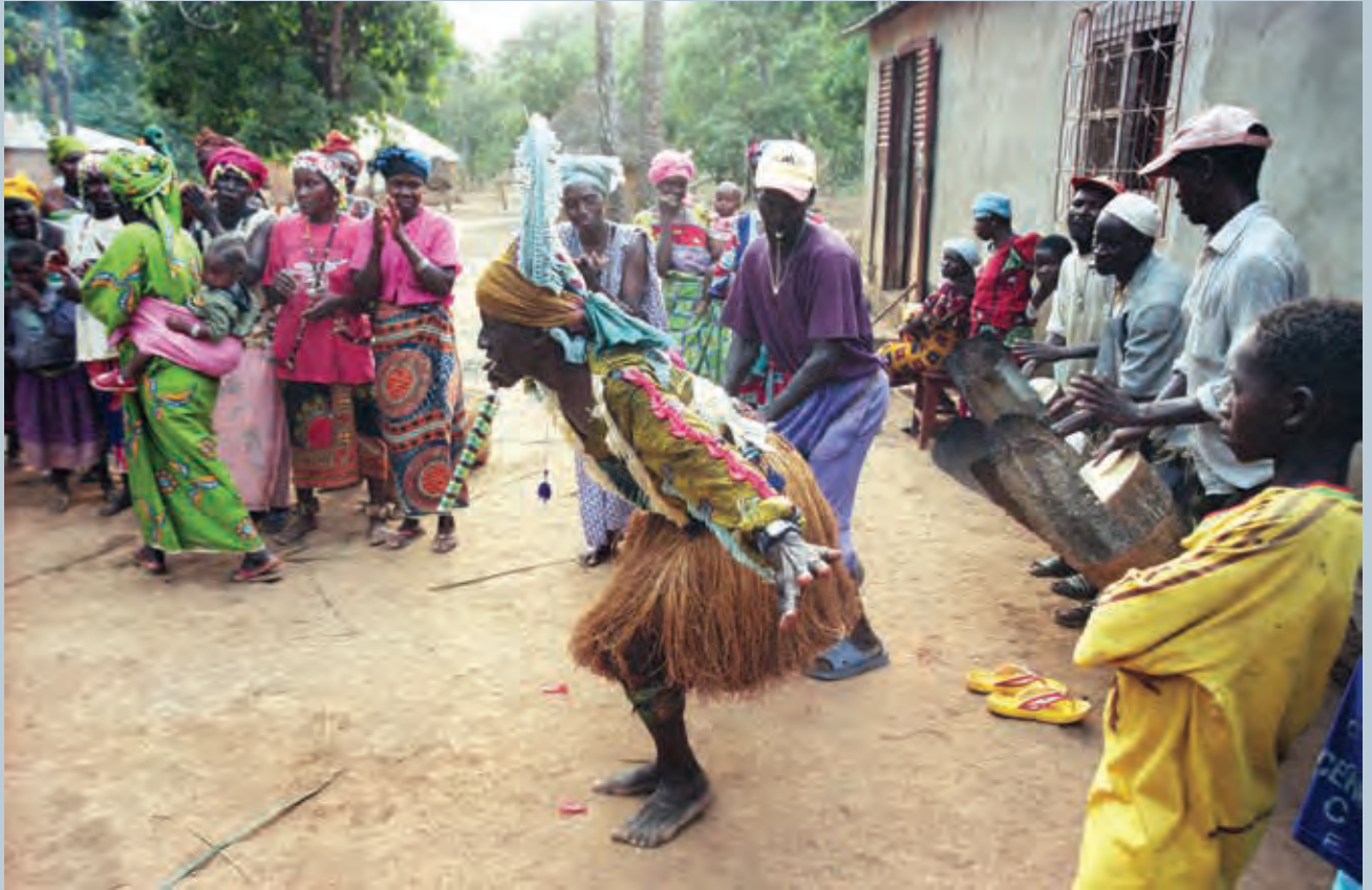
ou défier le danseur patenté du groupe.