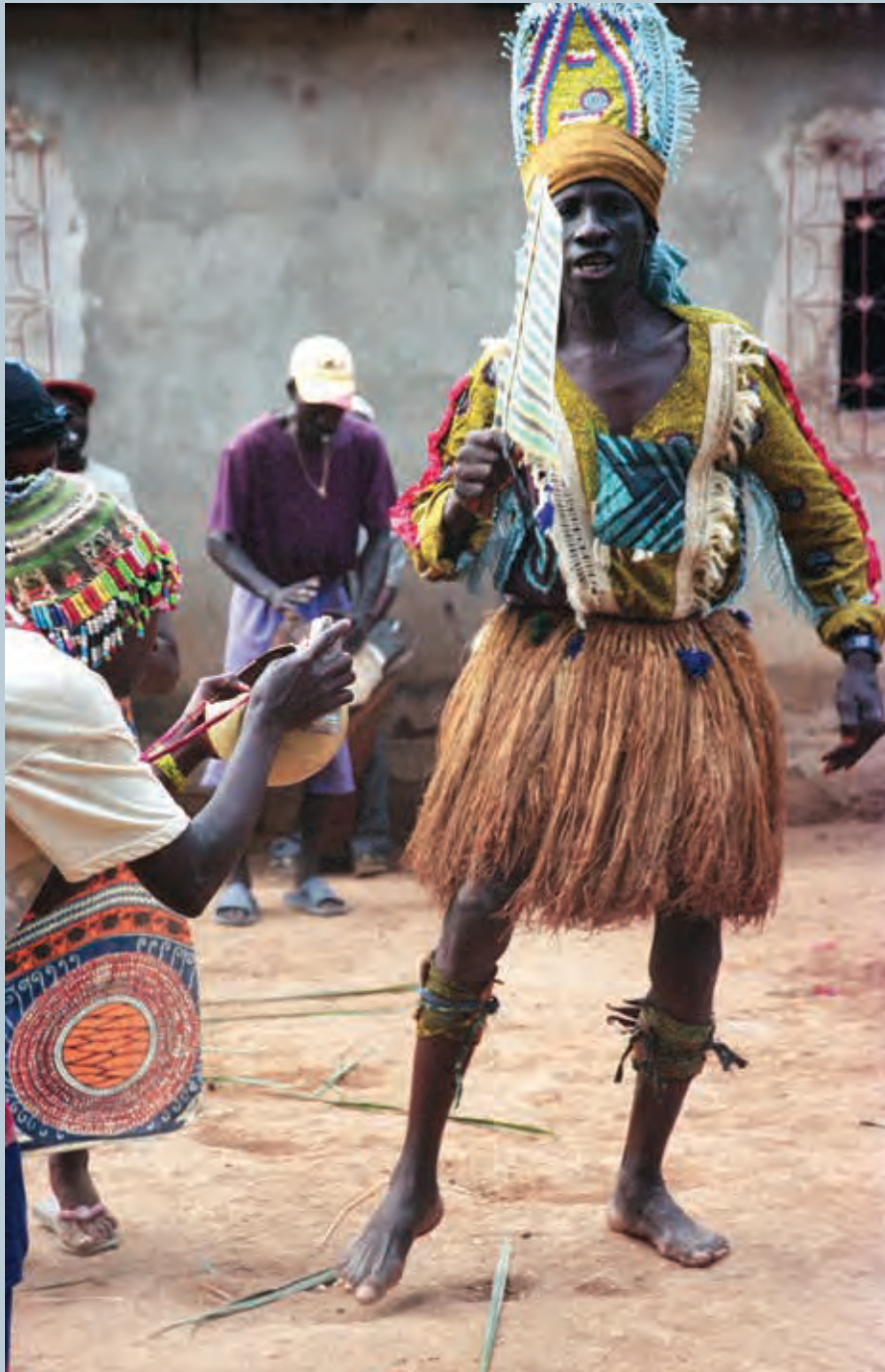
À l'instar de l'ethnologue, armée de sa cale-basse photo, une des femmes le photographie, et entre dans le cadre...